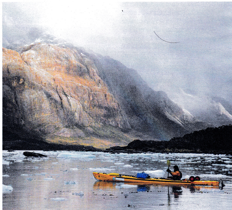
Visages RCF Christian Clot, des 70 °C du désert iranien aux eaux glacées de Patagonie.