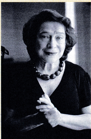
La pianiste russe aime jouer Bach. En privé.